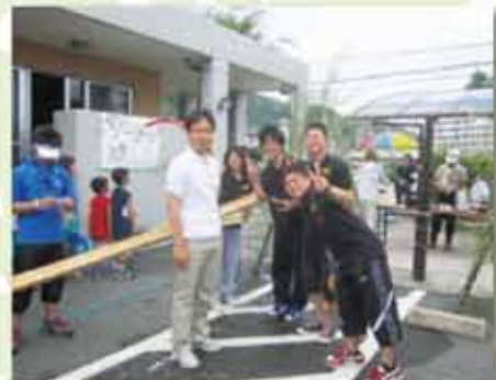
公民館のイベントに若い世代の人と共に参加