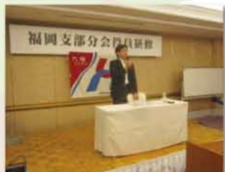
企業や団体で講師として政治を解りやすく説明