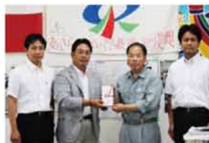
東松島市長に直接義援金を渡しました

8月に東日本大震災で被害を受けた宮城県の石巻市、仙台市、東松島市、女川町を訪問しました。福岡県の職員が派遣されている東松島市では義援金を直接市長に渡し、市長からは震災被害の状況や復興への計画等を聞か