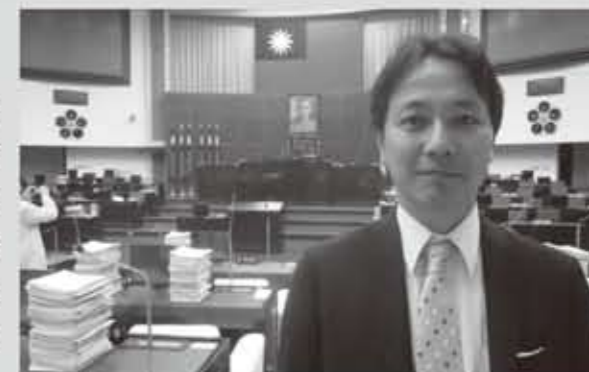
台北市議会の議場にて

1972年の国交断絶後も人と物の活発な展開が続いたにも関わらず、国交がないため政治交流はもとより自治体間交流も積極的ではありませんでした。我が県はこれまで麻生前知事を団長として台湾経済ミッションが現地を訪問しましたが、今回我が会派は「市場経済と農業事情」を主に中華民国対外貿易発展協会や台湾市暴力防止センター、台湾鉄道工会、台北市議会等を視察しました。