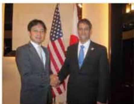
日米議連の事務局長として在福岡アメリカ領事と握手