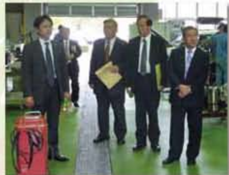
ハイブリット車の整備を行う久留米職業訓練校を訪問