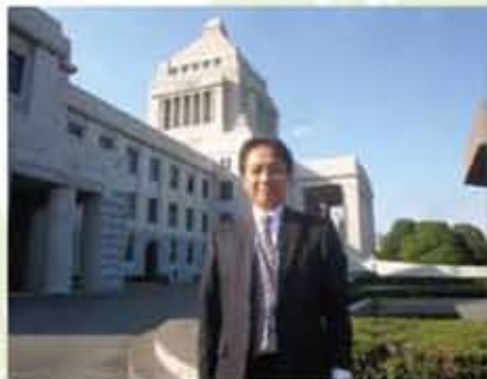
国と福岡県のつなぎ役として国会を訪問