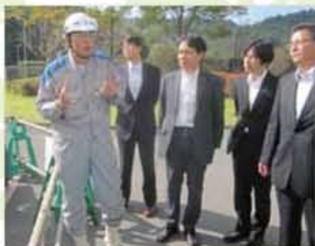
日本一の九州電力八丁原地熱発電所(大分)を視察