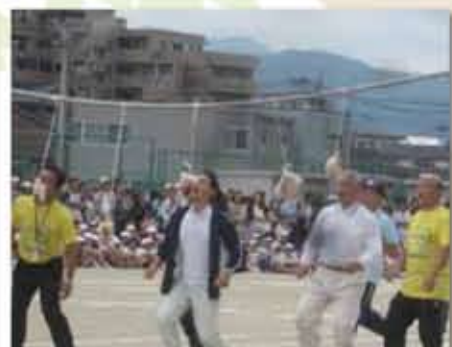
地域の体育祭に選手として競技に参加