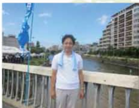
樋井川のいかだ祭りには審査員として参加