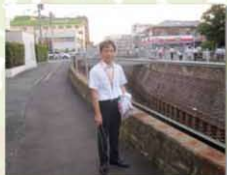
きれいな街づくりのために地域の清掃活動に参加