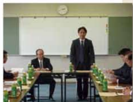
県議会景気・雇用特別委員会の委員長として挨拶