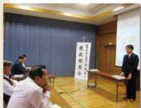
城南区内の各公民館で定例県政報告会を実施中