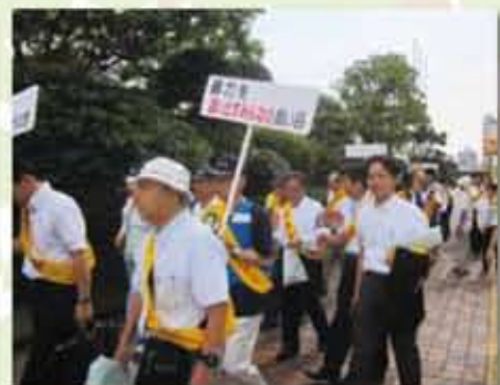
親力団のいない街をめざして街頭行進を行う