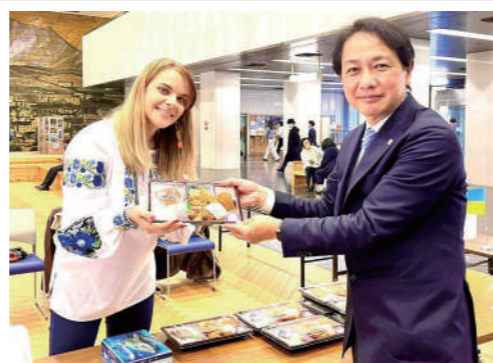
県庁で開催されたウクライナ支援のイベントに参加しました。