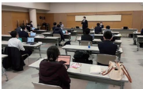
政治を身近に感じてもらう活動として「県政報告会」を開催しました。

PROFILE 昭和40年 6月21日/福岡生まれ 昭和59年 西南学院高等学校卒業 平成 元年 西南学院大学商学部商学科卒業 平成 元年 近畿日本ツーリスト(株)入社 平成 8年 衆議院議員秘書(国会内)