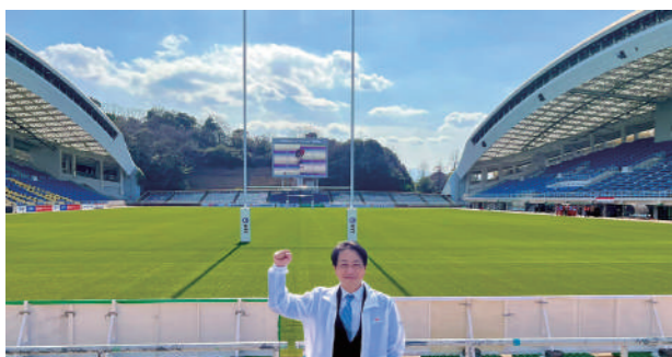
ラグビー等のスポーツ振興のためにボランティア活動を行いました。