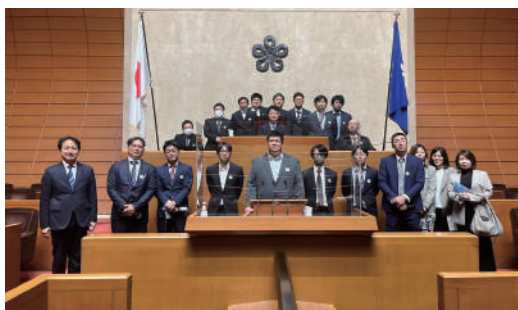
政治を身近に感じてもらう活動として九電工労組の皆さんに県議会を訪問して頂きました。