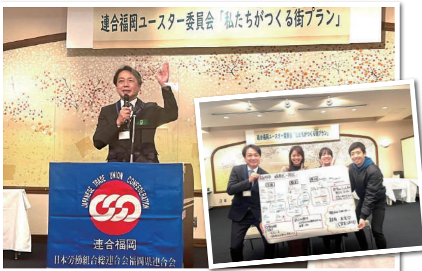
連合議員懇談会の幹事長として県政報告を交えて挨拶を行いました。