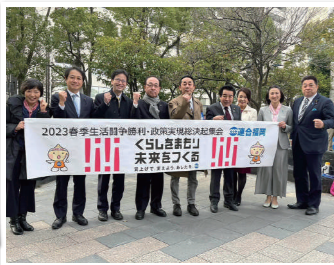
連合福岡政策制度実現のためのイベントに参加しました。