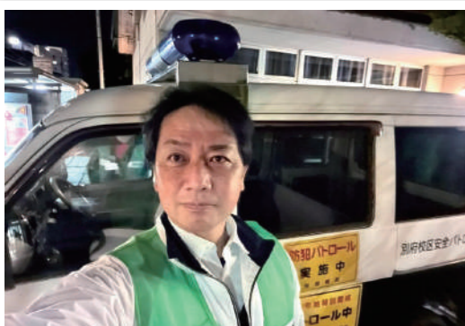
別府校区おやじの会の皆さんと防犯夜警を行いました。