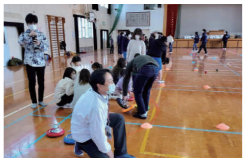
地域の健康増進のための「南片江校区レクリエーション大会」に参加しました。