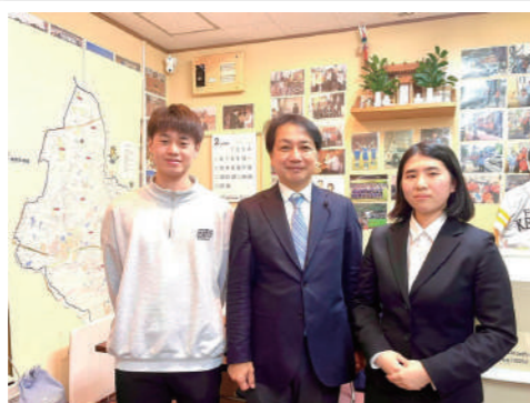
学生インターン生を事務所に迎え入れ16年が経ちました。