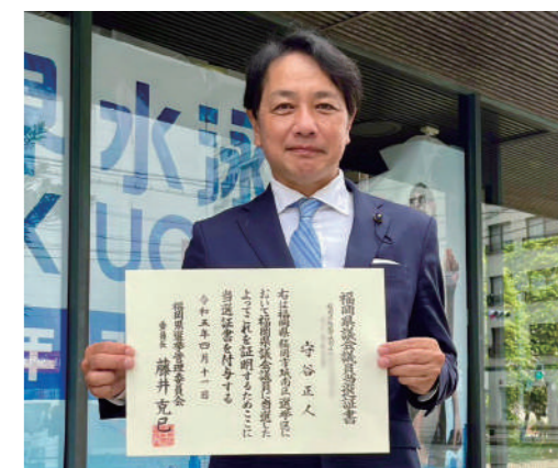
4月11日城南区役所にて当選証書を受け取りました