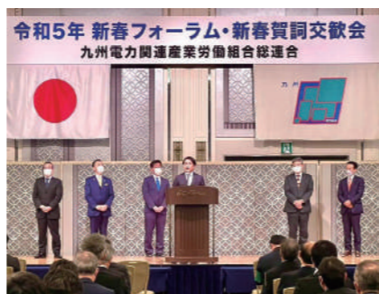
県政報告を交えて挨拶を行いました。