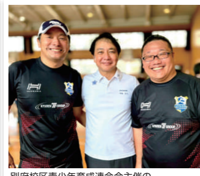
別府校区青少年育成連合会主催の「タグラグビー」に参加しました。