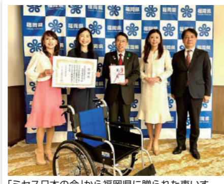
「ミス日本の会」から福岡県に贈られた車いす 贈呈式に立ち合いました。