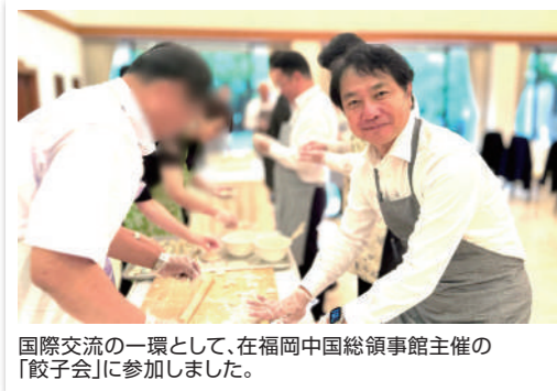
国際交流の一環として、在福岡中国総領事館主催の「餃子会」に参加しました。