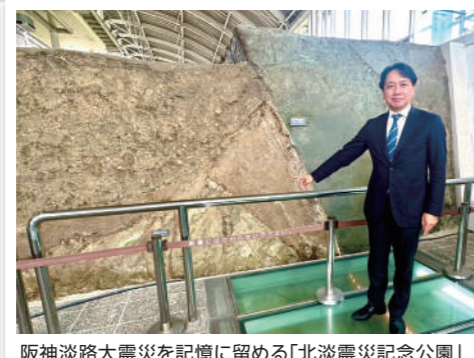
阪神淡路大震災を記憶に留める「北九州震災記念公園」を訪問しました。