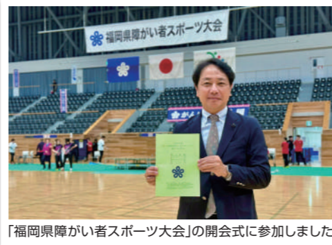
「福岡県障がい者スポーツ大会」の開会式に参加しました。