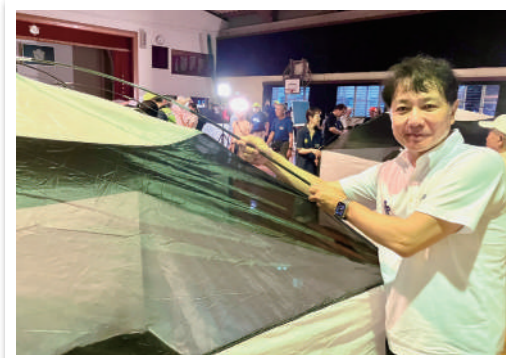
堤小学校で行われた夜間の避難所設置訓練に参加しました。