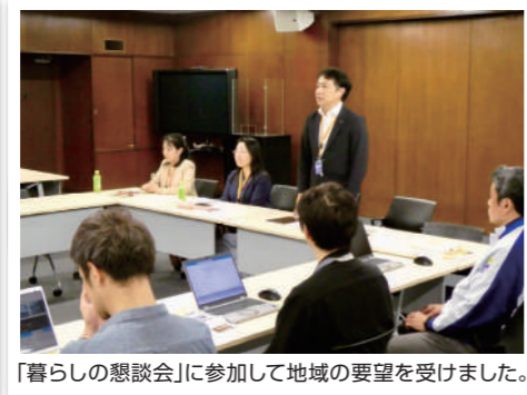
「暮らしの懇談会」に参加して地域の要望を受けました。