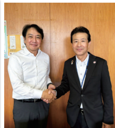
新しく就任された福岡県教育委員会 寺崎雅巳教育長と共に。