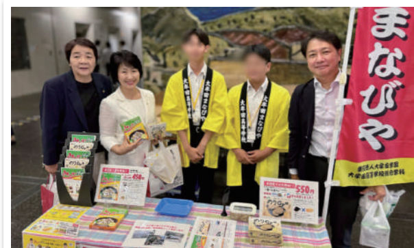
県内の専門高校生が地域と連携して開発した商品の販売会に参加しました。