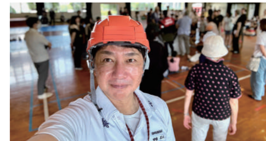
「福岡市総合防災訓練」に参加しました