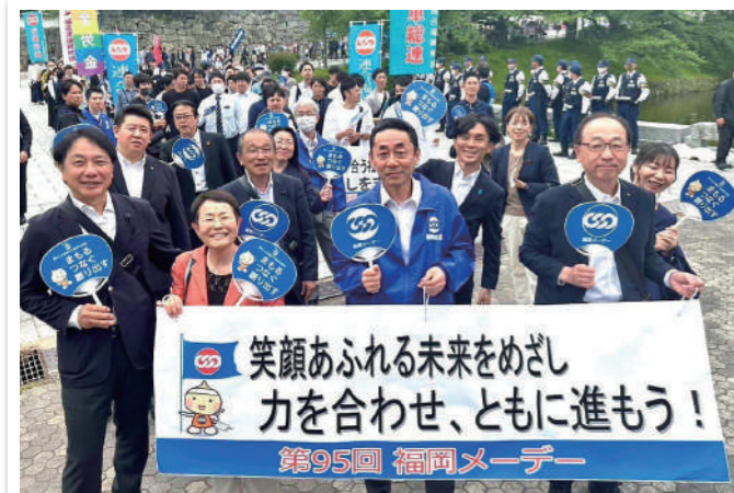
「第95回連合福岡メーデー」に参加しました。