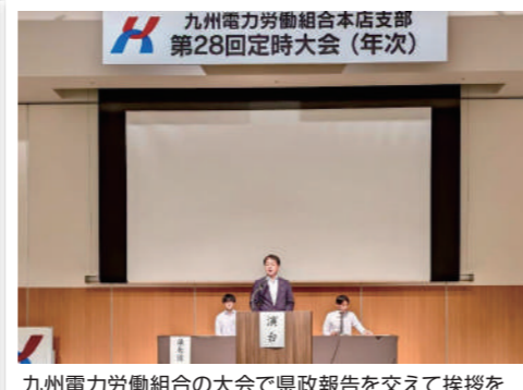
九州電力労働組合の大会で県政報告を交えて挨拶を行いました。