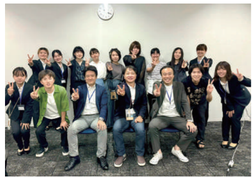
県内の大学生の皆さんと将来の日本・福岡について語り合いました。