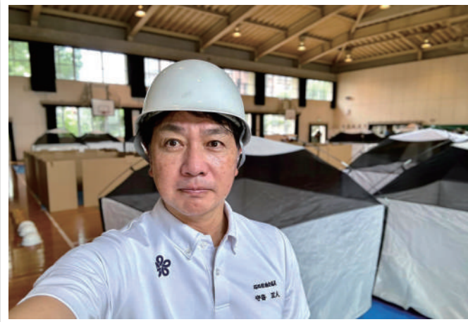
「城南校区防災訓練」に参加しました。