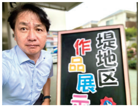
公民館で開催された堤地区「作品展」を訪問しました。