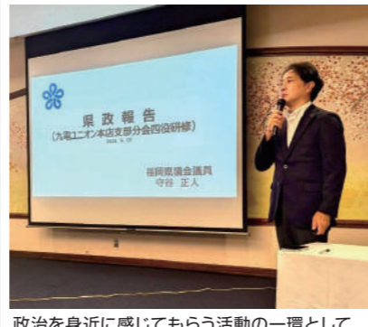
政治を身近に感じてもらう活動の一環として「県政報告」を行いました。