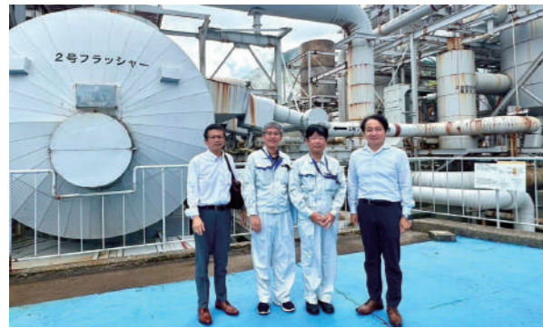
大分県九重町の八丁原地熱発電所を会派で視察しました。