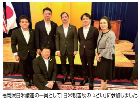
福岡県日米議連の一員として「日米親善秋のつどい」に参加しました。