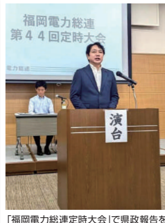
「福岡電力総連定時大会」で県政報告を交えて来賓挨拶を行いました。