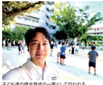
子ども達の健全育成の一環として行われる「ラジオ体操」のお手伝いを行いました。