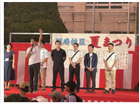
各地で開催された「夏まつり」に参加しました。