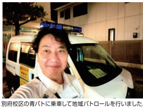
別府校区の青パトに乗車して地域パトロールを行いました。