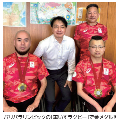
パリパラリンピックの「車いすラグビー」で金メダルを獲得された福岡県ゆかりの選手の皆さんと共に。