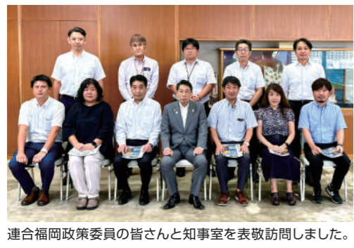
連合福岡政策委員の皆さんと知事室を表敬訪問しました。