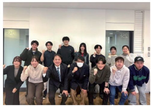
福岡大学の学生の皆さんと幅広い分野で意見交換を行いました。