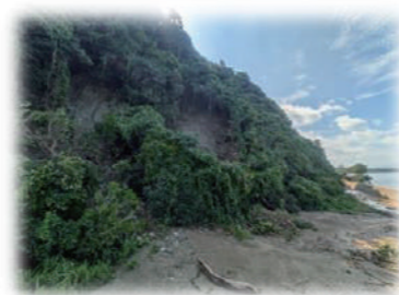
<織幡神社イヌマキ天然林の被害状況>