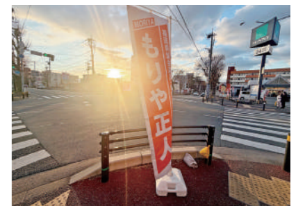
素晴らしい初日の出を見ることが出来ました。