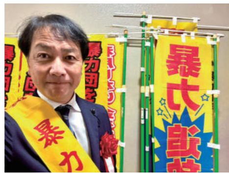
「早良・城南・西暴力団追放市民総決起大会」に参加しました。