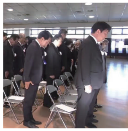
「福岡県殉職警察職員慰霊祭」に参列しました。