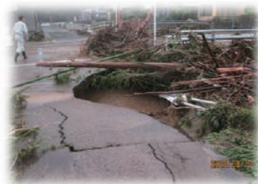
<本木川の被害状況>