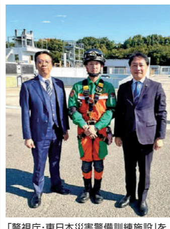
「警視庁・東日本災害警備訓練施設」を警察委員会で視察しました。