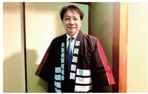
早良消防団長尾分団の出初式で年始の挨拶を行いました。