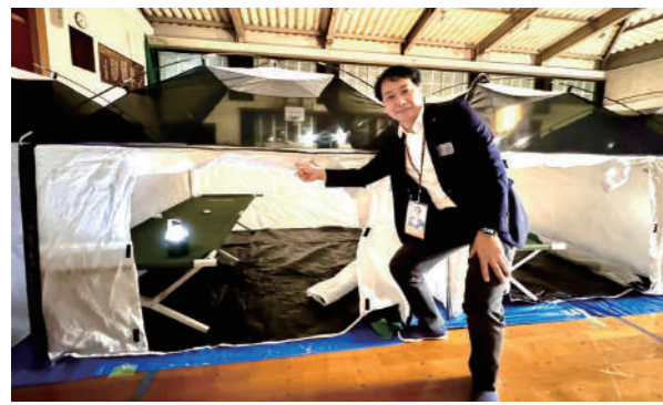
堤小学校で行われた「夜間避難所開設訓練」を視察しました。