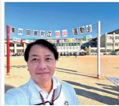
「南片江校区の防災運動会」を視察しました。