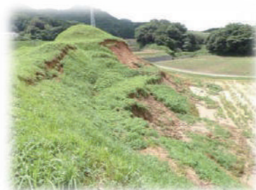
<新原・奴山古墳群の被害状況>