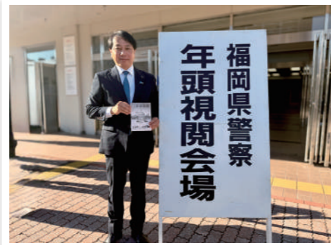
令和8年福岡県警察年頭視閲式を訪問しました。