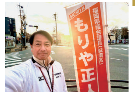
元旦の朝は、島廻り橋西交差点で新年の挨拶を行いました。