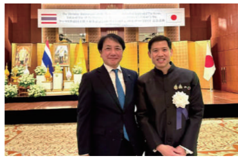
「タイ王国ナショナルデー」のイベントに参加しました。