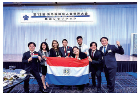
「第12回海外福岡人会世界大会」に参加しました。