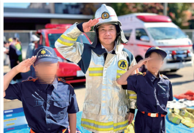
福岡市少年消防団員の子も達と共に。